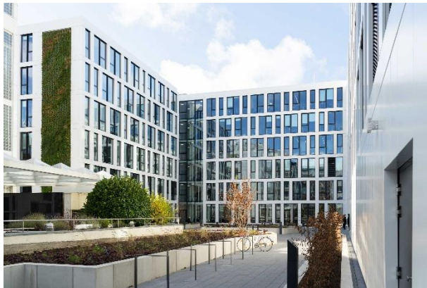
Abb. 4. Züblin Innovation Center Stuttgart, Außenansicht