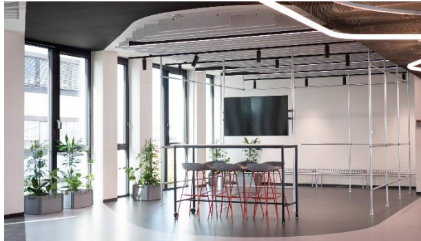
Abb. 3. Züblin Innovation Center Stuttgart: Hub Space