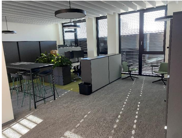
Abb. 5. Züblin Innovation Center Stuttgart

Die Ed. Züblin AG , Stuttgart, beschäftigt rd. 15.000 Mitarbeiter:innen und ist mit einer jährlichen Leistung von rd. 4,5 Mrd. € eines der größten deutschen Bauunternehmen. ZÜBLIN realisiert seit 1898 erfolgreich anspruchsvolle Bauprojekte im In- und Ausland und ist im STRABAG-Konzern die führende Marke für Hoch- und Ingenieurbau. Das Leistungsspektrum umfasst alle baurelevanten Aufgaben – vom komplexen Schlüsselfertigbau, Ingenieur- und Tunnelbau bis hin zu Baulogistik, Bauwerkserhaltung, Spezialtiefbau, Holz- oder Stahlbau. Gestützt auf das Know-how ihrer Zentralen Technik bietet ZÜBLIN zudem integriertes Planen und Bauen aus einer Hand an. Wir betrachten Bauwerke ganzheitlich, über den gesamten Lebenszyklus, setzen auf partnerschaftliches Bauen mit TEAMCONCEPT® und treiben Digitalisierung, Nachhaltigkeit und Innovation stetig voran. Gemeinsam, im STRABAG-Konzernverbund und mit externen Partner:innen, arbeiten wir konsequent daran, Planen und Bauen ressourcenschonend und klimaneutral zu machen. Aktuelle ZÜBLIN-Bauprojekte sind unter anderem das Hochhausprojekt EDGE East Side Berlin, das US-Klinikum Weilerbach oder der rd. 2 km lange Flughafentunnel in Stuttgart. Weitere Informationen unter www.zueblin.de