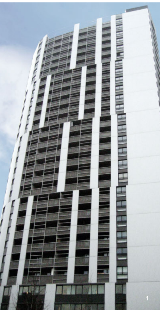
1 Wohnhaus und Büros Höchstädtplatz 4, Wien/ 2+3 Umlaufanlage Produktionshalle für Doppelwände und Elementdecken / 4 Wohnhaus Breitenleerstr. 270, Wien / 5 Geriatrie Kabelwerk Bauplatz K, Wien / 6 Wohnhaus und Büros Höchstädtplatz 4, Wien / 7 Wohnhaus Löschniggasse 2, Wien / 8 Wohnhaus, Kagranner Spange Bauplatz 4, Wien / 9 Wohnhaus, Doningasse/Aladar Pecht Gasse, Wien

Auf Anfrage sind auch detaillierte Produktblätter erhältlich!