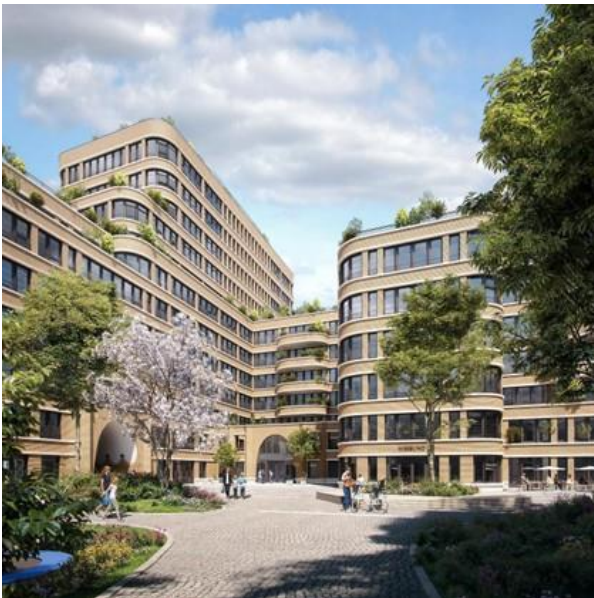
Hofansicht B'Ella Berlin